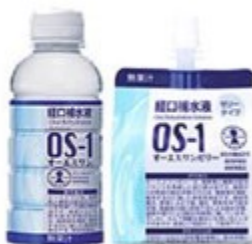
病者用食品(個別評価型)

商品としてはオーエスワン、オーエスワンゼリー、低リンミルク L.P.K などがあります。