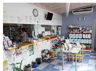
どうぞ、お気軽にお越しください!!

あおぞら薬局は、JR新飯塚駅から徒歩約5分の所にあります。スタッフは2名の薬剤師と4名の事務職員です。通院が困難な方への薬剤訪問にも積極的に取り組んでいて、現在150名ほどの方にお薬をお届けし、在宅療養のお手伝いをしております。これからも、地域の健康をサポートできるよう努力していきますので、薬や健康のことなど、お気軽にご相談ください。