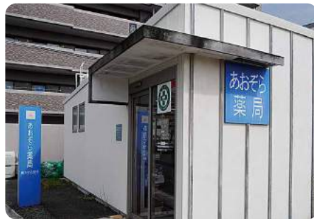
青い看板が目印です!!

あおぞら薬局は、JR新飯塚駅から徒歩約5分の所にあります。スタッフは2名の薬剤師と4名の事務職員です。通院が困難な方への薬剤訪問にも積極的に取り組んでいて、現在150名ほどの方にお薬をお届けし、在宅療養のお手伝いをしております。これからも、地域の健康をサポートできるよう努力していきますので、薬や健康のことなど、お気軽にご相談ください。